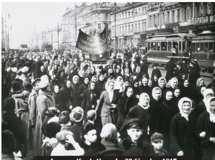
la manifestation du 23 février 1917